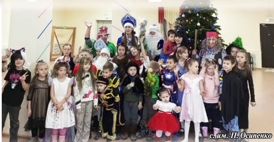
с. им. П. Осипенко