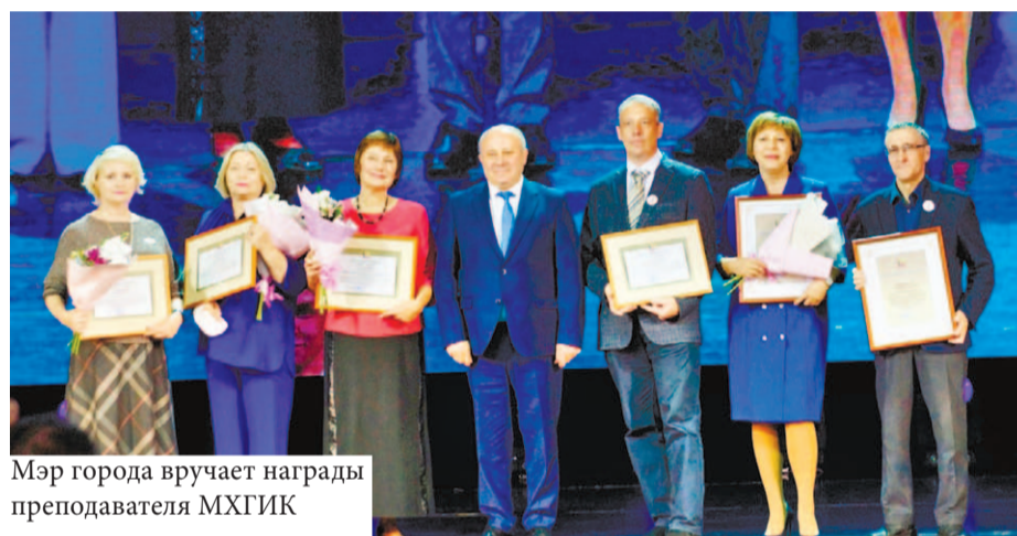
Мэр города вручает награды преподавателя МХГИК

образование, – выпускники ХГИК. В Хабаровском же крае процент работающих выпускников института в учреждениях культуры и искусства значительно выше.