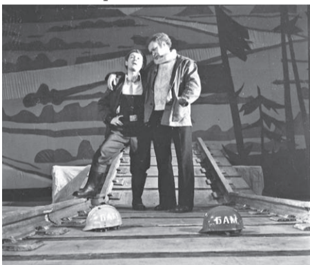
Сцена из спектакля «Звездный час». Театр драмы. Хабаровск. 1976 г.

8 июля 1974 г. вышел приказ по управлению культуры Хабаровского крайисполкома №154 «О культурном обслуживании строителей Байкало-Амурской железнодорожной магистрали», предписывавший профильным отделам Комсомольского и Верхнебуреинского районов, Хабаровска и Комсомольска-на-Амуре разработать годовые планы мероприятий по обслуживанию БАМа. Этот документ стал основополагающим при подготовке конкретных планов проведения культурных мероприятий в полосе строящейся железной дороги.