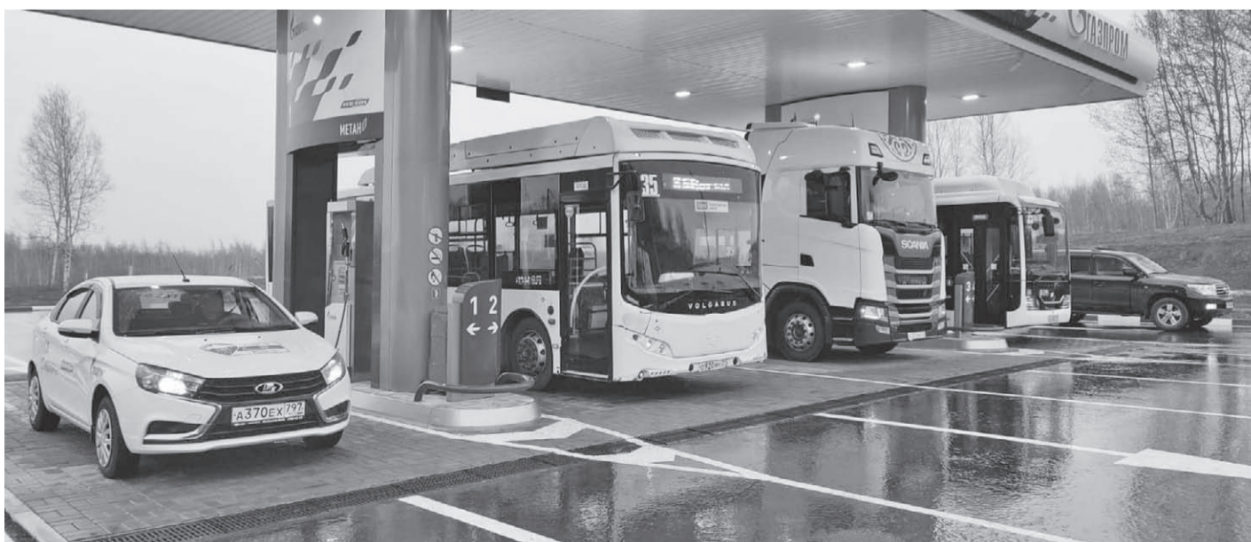
Первая в Хабаровске заправка компании «Газпром газомоторное топливо»

– Дорожный сервис там многофункциональный, с максимумом удобств для водителей и пассажиров. Мы же только в самом начале пути, – констатировал он.