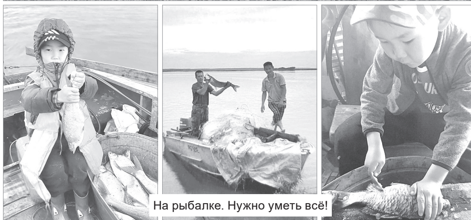
На рыбалке. Нужно уметь всё!