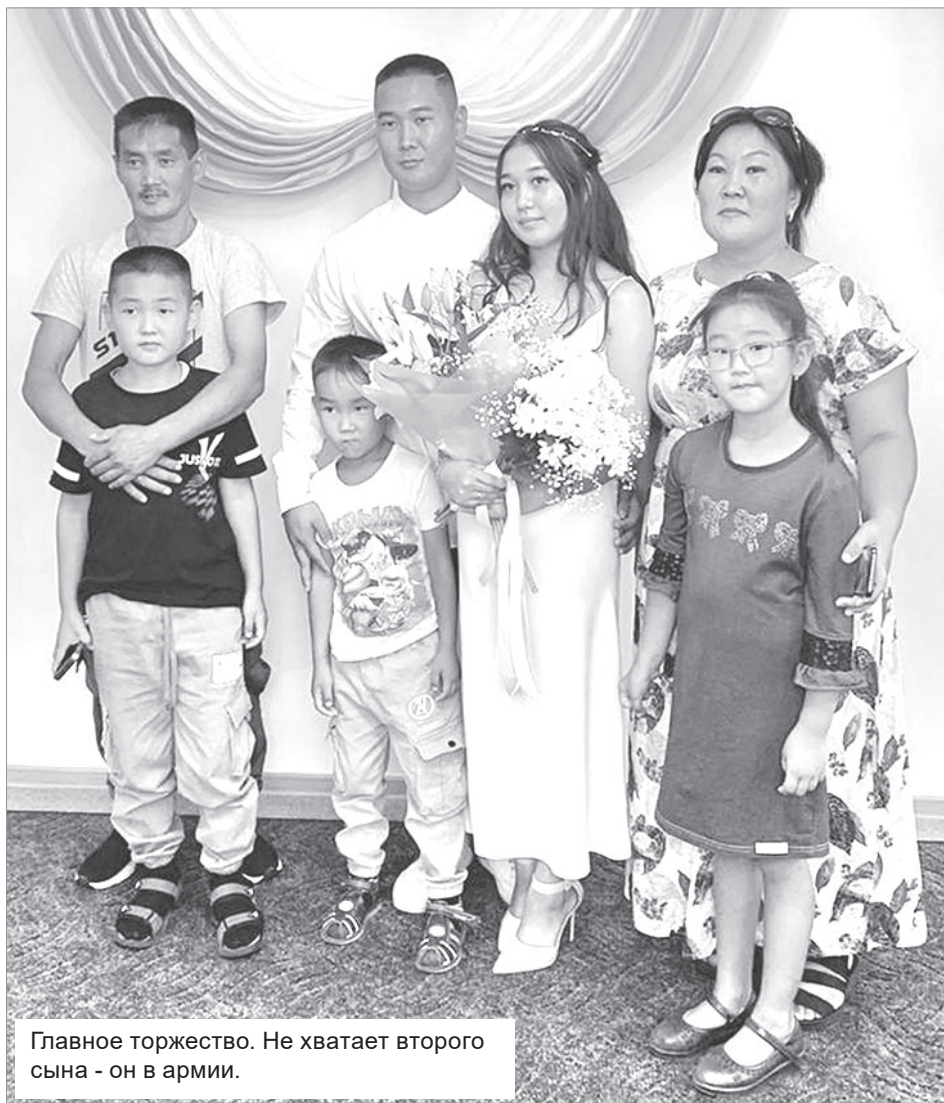
Главное торжество. Не хватает второго сына - он в армии.

Н аверное, в детстве каждая девочка мечтает о большой полной семье. С возрастом и приходом осознания бытия жизни, «аппетит» у новоиспеченных семей часто снижается. Потому что стеной ненароком встают вопросы: как всех вырастить? Как всех прокормить и обеспечить? Программы помощи семьям, несомненно, работают, но общей ситуации со страхами это не меняет. Так было и с нашей героиней.