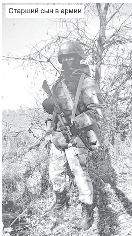
Старший сын в армии

телефоны, одевались, во что хотели. И по дому, естественно, помогать успевали – и огород, и дрова зимой. Папа заготавливает, а дети перекалывают. Ко всему прочему, папа у нас заядлый рыбак. У него работа – это рыбалка! И потому дети у нас тоже умеют рыбачить.