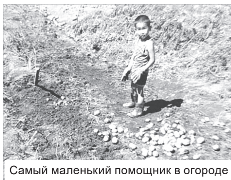
Самый маленький помощник в огороде