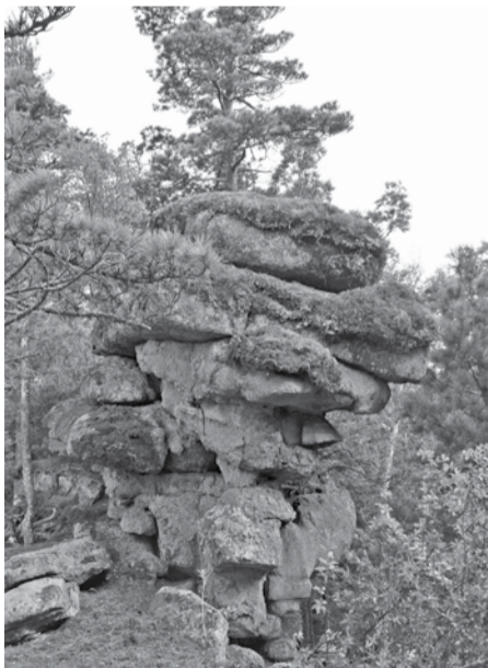
«НЕ МЕДВЕДЬ, А ОБЕЗЬЯНА!»