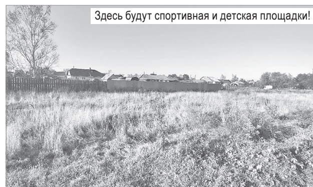
Здесь будут спортивная и детская площадки!

Свой первый проект «Время первых» выиграл недавно созданный ТОС «Рублёвка» (с. Троицкое). И получит из краевого бюджета 770 400 рублей. 110 тысяч рублей на этот проект запланировано и в бюджете сельской администрации. Конечно, предусмотрена и добровольная помощь самих участников ТОС, поскольку в районе, где планируется строительство спортивной площадки, проживает много молодых