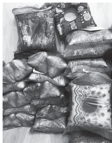
Подушечки в госпитали от «Рукотворушек».

Мастерицы районного творческого объединения «Рукотворушки» не понаслышке знают, что значит задать родных с фронта. У кого-то там, «за лентой», сын, у других – муж, внук, брат или племянник. И связать или сшить одежду для наших бойцов стало потребностью лазовских женщин. Вместе с вещами они словно передают им частицу своей души, тепла, любви и заботы. И им уже неважно, кто воюет на фронте или находится на излечении в госпитале, – свой сын или нет, и кто получит в посылке теплые носки, варежки, нательное