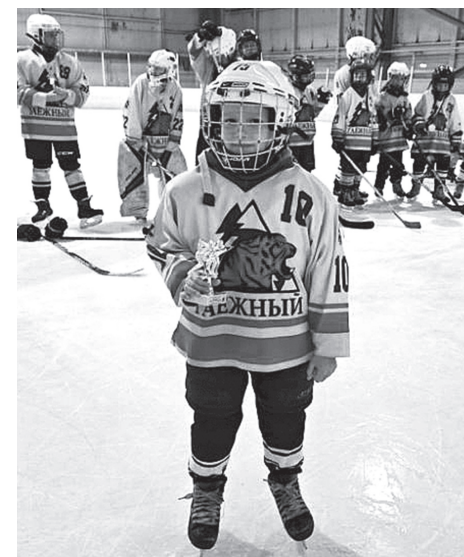
«Таёжный» – так держать!