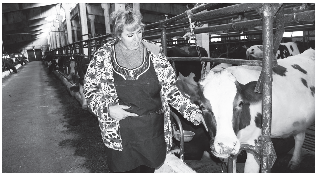
На животноводческой ферме сельхозпредприятия «Амурская заря»

На грантовые средства фермеры приобрели трактора, сельхозтехнику, построили сезонные теплицы, капитально отремонтировали овощехранилища, приобрели необходимый инвентарь для засолки овощей,