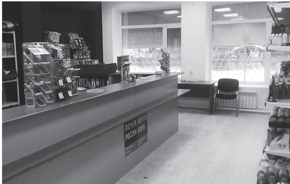
Мухенская почта – просто подарок!

Вопросами капитального ремонта муниципального помещения занималась администрация района, а «Почта России» оборудовала его современными рабочими местами.