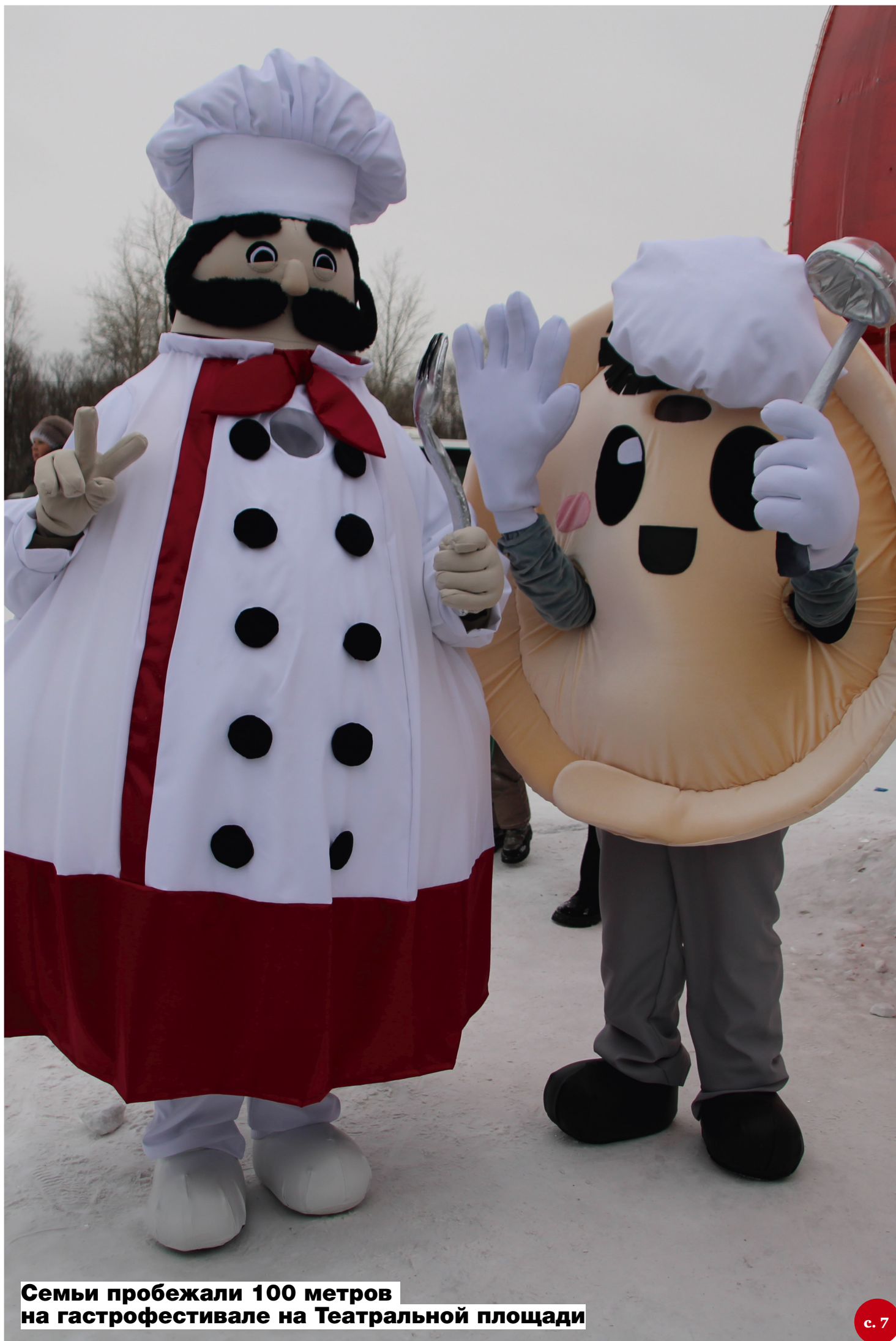
Семьи пробежали 100 метров на гастрофестивале на Театральной площади