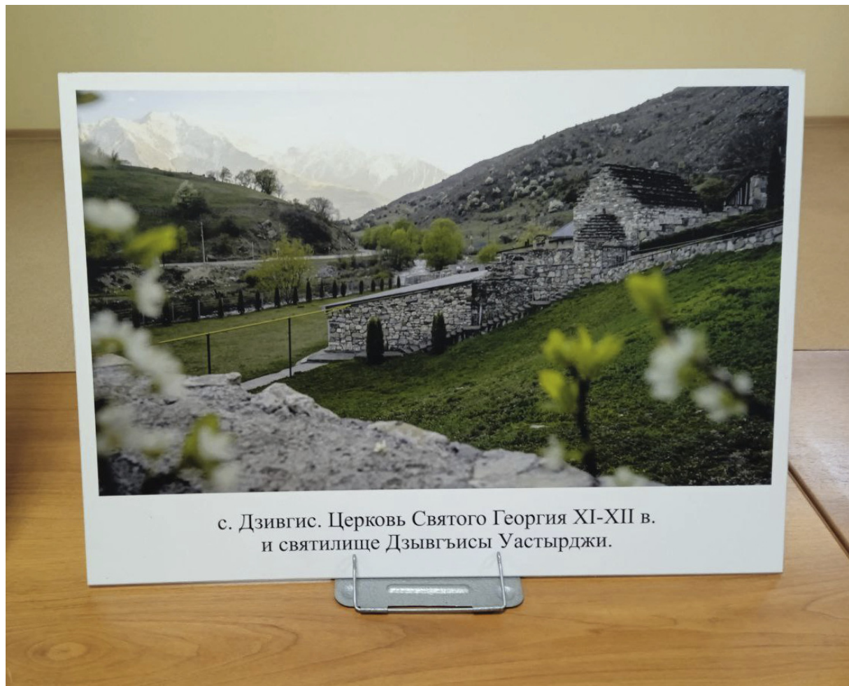
с. Дзивгис. Церковь Святого Георгия XI-XII в. и святилище Дзивгъисы Уастырджи.

Выставка открылась в Северной Осетии, а затем побывала в регионах Северного Кавказа, в Москве и в Санкт-Петербурге