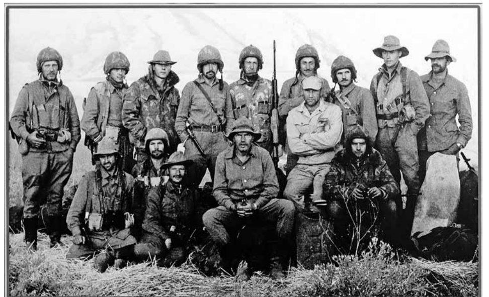
Нештатная боевая группа, состоящая из сотрудников группы «А» (в том числе хабаровчан), направленных в Афганистан на боевую стажировку, осень 1985 г.

В этот день на всей территории России проводятся памятные мероприятия. Проходят они и в Хабаровском крае. По традиции колонна ветеранов боевых действий разных лет, прошедших горячие точки в Афганистане, на Северном Кавказе, в других странах и регионах, представителей общественных организаций и властей прошла от Комсомольской площади до площади Славы. Также состоялась церемония возложения венка и цветов у мемориала «Черный тюльпан» на набережной краевой столицы.