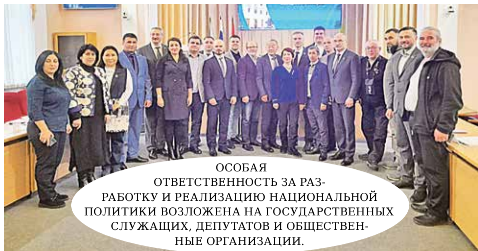
ОСОБАЯ ОТВЕТСТВЕННОСТЬ ЗА РАЗРАБОТКУ И РЕАЛИЗАЦИЮ НАЦИОНАЛЬНОЙ ПОЛИТИКИ ВОЗЛОЖЕНА НА ГОСУДАРСТВЕННЫХ СЛУЖАЩИХ, ДЕПУТАТОВ И ОБЩЕСТВЕННЫЕ ОРГАНИЗАЦИИ.