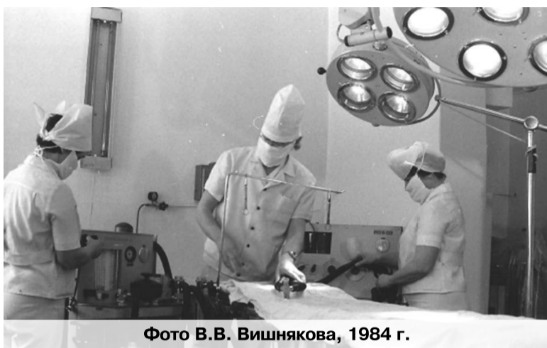
Фото В.В. Вишнякова, 1984 г.

Тогда, как сообщают источники «... народное здравоохранение хотя и удовлетворяет первоочередные нужды, однако, требует в ближайшее время принятия мер к улучшению его, ибо существующие амбулатории уезда, города и рыбных промыслов, все же не отвечают действительным требованиям, а уездно-городская больница, как по своему оборудованию, так и вместимости, в ближайшее время не сможет удовлетворить тех требований, которые к ней предъявляются, и особенно в летнее время с открытием работ на рыбных промыслах. Кроме того, обширность территории, по которой разбросано население, настоятельно диктует о необходимости установления врачебных пунктов, хотя бы трех: Керби, Богородское и Чумикан, а также установление нескольких фельдшерских пунктов в приисковых районах, поскольку там начинают скопляться рабочие, но вследствие скудности нашего бюджета, мы и в предстоящем сметном 1925 году не предполагаем увеличить сети учреждения Уездная, да и вообще, без посторонней помощи мы не можем этого осуществить еще долгое время...».