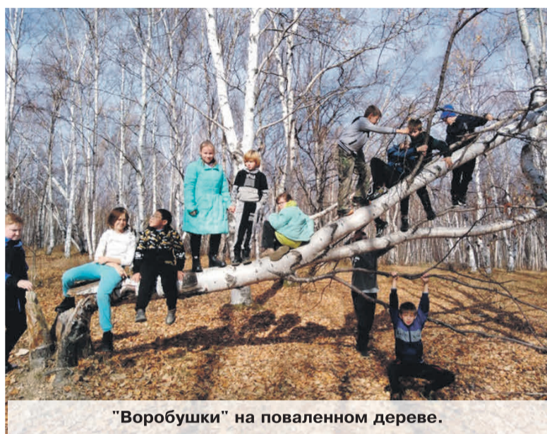
"Воробушки" на поваленном дереве.

Природа предоставляет для нашего существования всё необходимое: и воздух, и воду, и пищу, и одежду, и кров, и многое другое. Воздействуя на чувства людей своей яркостью, многообразием, динамичностью, она оставляет глубокий след в их душах. Сама природа не воспитывает, воспитывает активное взаимодействие с ней. Развивая у детей любовь к растениям, животным способна положить начало многим познавательным и практическим интересам. Никакой учебник, несмотря на большое количество в нем рисунков, фотографий, текстов и практических заданий, не сможет заменить живого общения детей с природой.