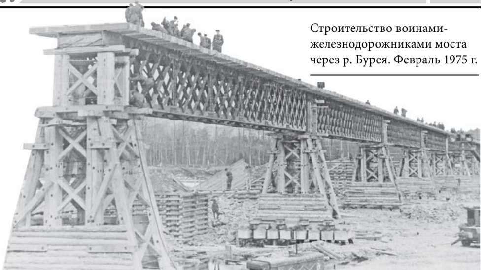
Строительство воинами-железнодорожниками моста через р. Бурея. Февраль 1975 г.

«...Работа развернулась в двадцатых числах июля 1975 года. Требовалось вывезти свыше 30 тыс. кубометров льда. Как организовать работу, чтобы поставленную задачу выполнить в срок? Этот вопрос волновал всех, в том числе и меня – командира подразделения воинов-железнодорожников, которому было поручено расчищать тоннель.