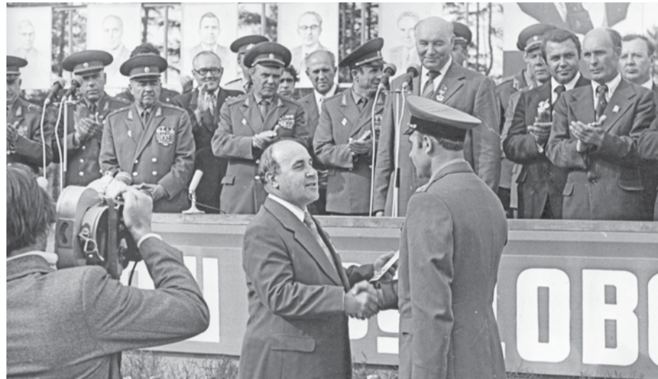
Первый секретарь Хабаровского крайкома КПСС А.К. Черный вручает Почетные грамоты строителям ст. Уркальту.

Воины-железнодорожники приняли участие в возведении большинства наиболее значимых объектов БАМа. На Восточном участке магистрали солдатами и офицерами 1-го корпуса было отсыпано 220 млн кубометров скального грунта, построено 1277 железнодорожных мостов и водопропускных труб, проложено 1800 километров кабельных линий связи, возведено 440 тыс. кв. м жилья, введено в эксплуатацию 25 станций и 69 развязок.