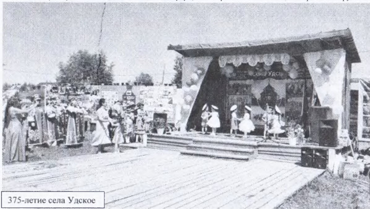
375-летие села Удское

Некоторое время здесь был В.В. Атласов - будущий покоритель Камчатки, который, по поручению