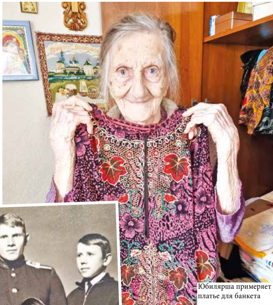
Юбилярша примеряет платье для банкета

– Ну, бывало, так, чуть-чуть обижуся на него. Но ведь наступает ночь, а кровать у нас узкая, да и одеяло полутораспальное. Так что обнимемся, укроемся одним одеялом и на этом мир. Это сейчас у супругов кровати – как футбольные поля. Вот и укатываются