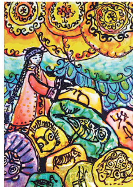
«Защитница». Дарья Кузминых