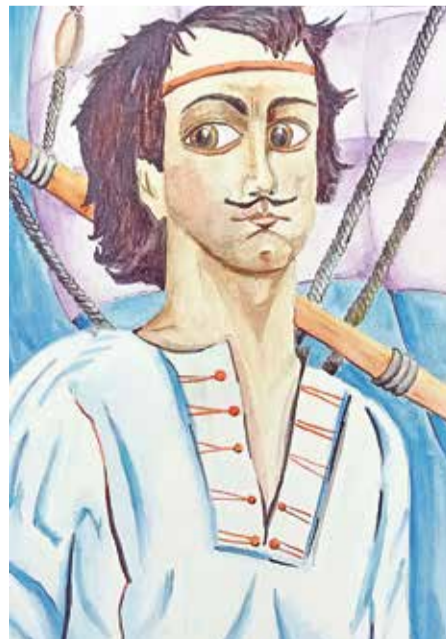
«Великий Пётр». Захар Ведяшов