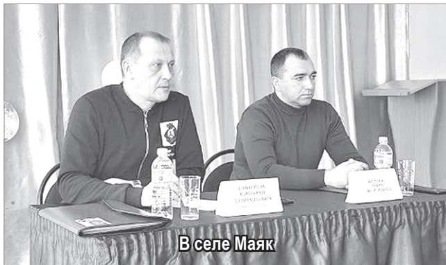
В селе Маяк