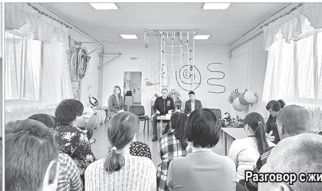
Разговор с жителями Синды