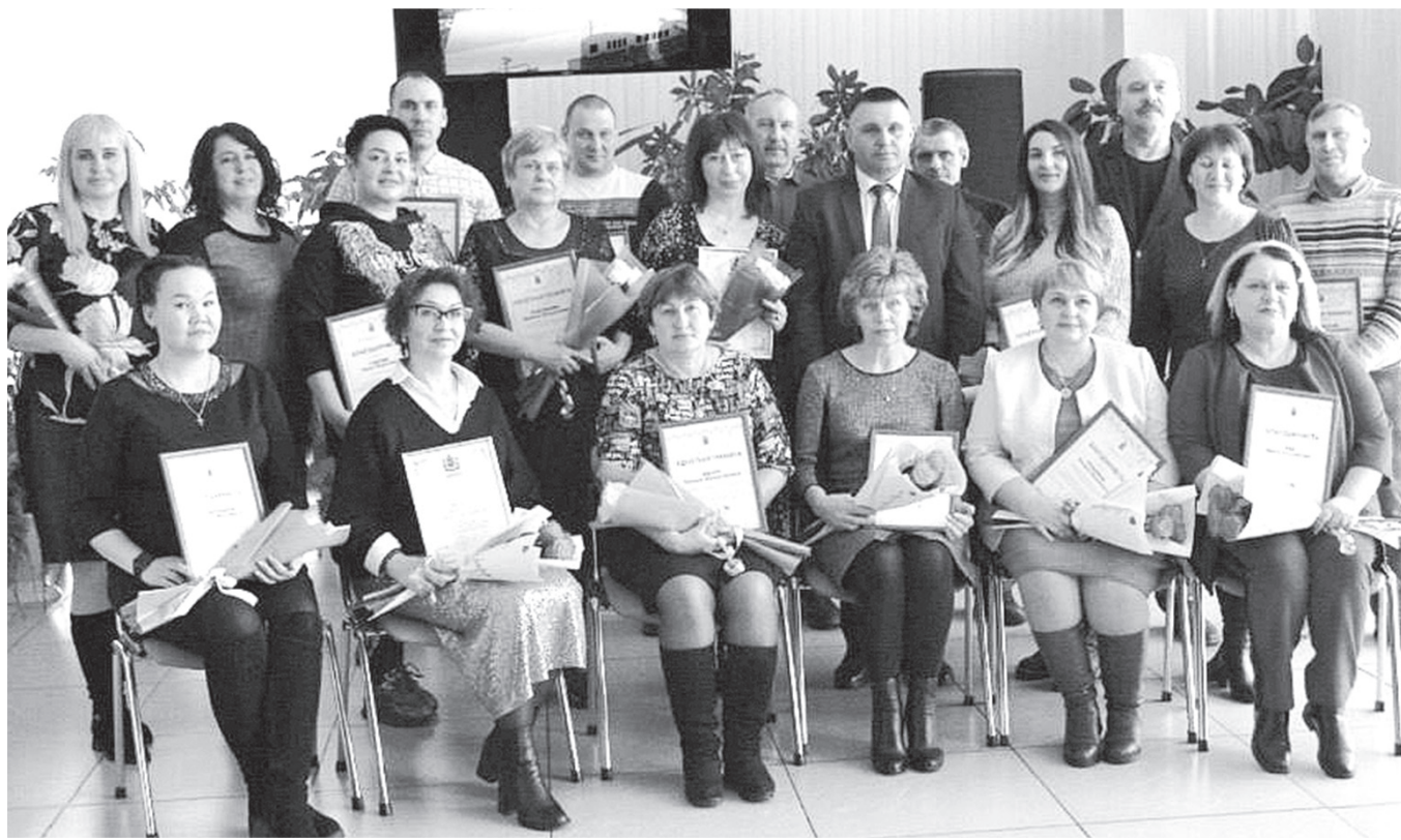
Лучшие коммунальщики и бытовики района

Торжественный приём главой района по случаю Дня работника бытового обслуживания и ЖКХ прошёл накануне их профессионального праздника в Переяславке, в доме культуры «Юбилейный».