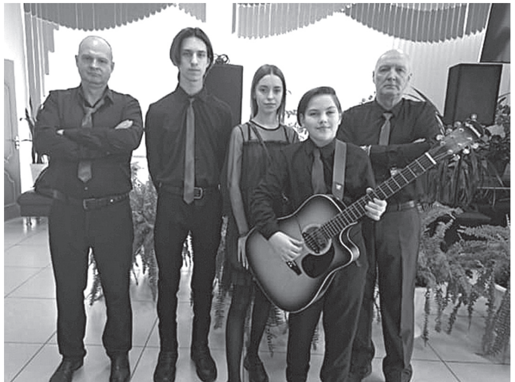
«Живое» звучание – это чудо рождения музыки здесь и сейчас.