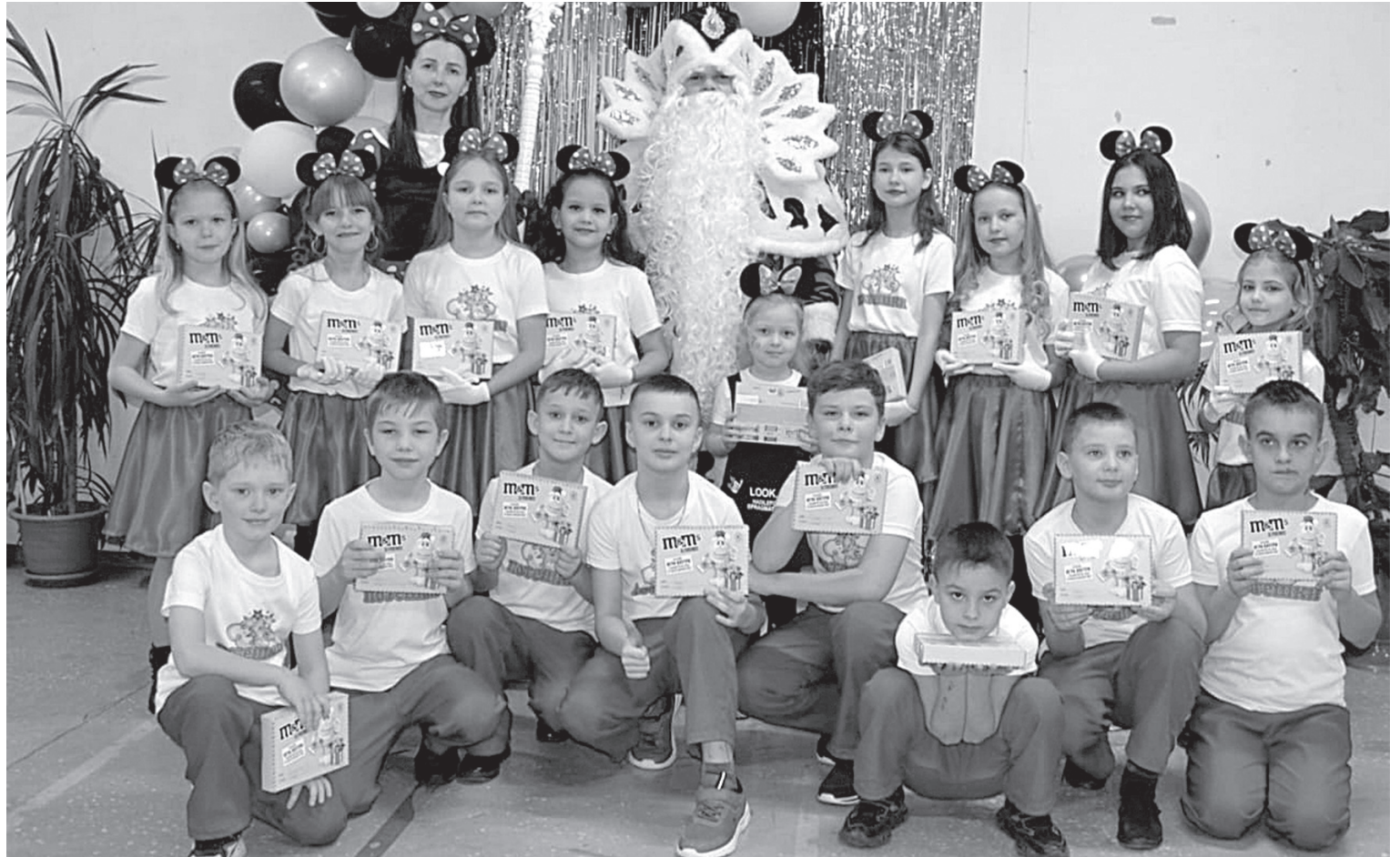
Мы просто хотим танцевать!

– Конечно, дети отсевались. Но сейчас коллективы сформированы, в них остался основной костяк. Можно сказать, ребята станцевались. А девочек из нашего первого коллектива «Задоринка» мы в этом году уже выпускаем. Можно будет набирать новичков.