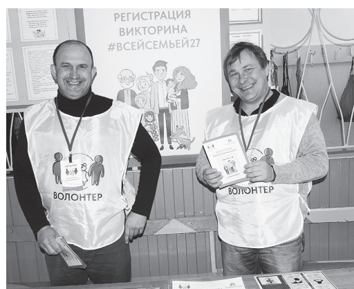
Соколовские волонтеры на выборах