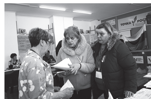
«Люди голосовали активно!» — довольны члены УИК.