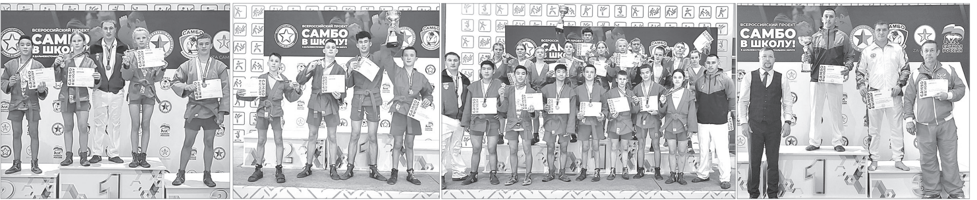
Фото из архива ШСК «Амба»