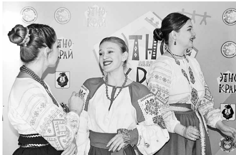
Ансамбль «Ялинка» из Полётного