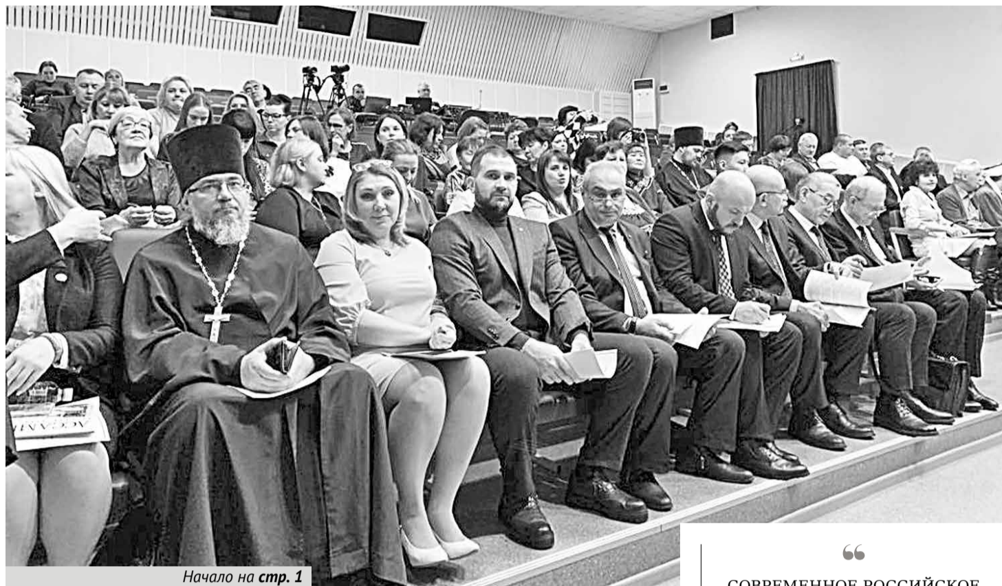
Начало на стр. 1

В частности, в течение 2022 года большая часть мероприятий была направлена на вопросы проведения Специальной военной операции по демилитаризации и денацификации Украины. Многие мероприятия организуются национальными и религиозными объединениями самостоятельно, что свидетельствует о высокой заинтересованности представителей гражданского общества в укреплении единства и сохранении целостности страны.