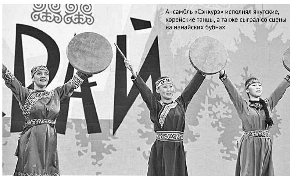
Ансамбль «Сэнкурэ» исполнял якутские, корейские танцы, а также сыграл со сцены на нанайских бубнах

В Хабаровске появилась ещё одна площадка, объединяющая национальные традиции нашего края, где живут представители не менее 140 народов. Первый фестиваль «ЭТНО-КРАЙ» состоялся 11 декабря в Доме офицеров Восточного военного округа. Его организовала молодёжная Ассамблея народов нашего региона при содействии Краевого дома дружбы «Русь» и регионального правительства. Наш корреспондент увидел, как фестиваль объединил культуры.