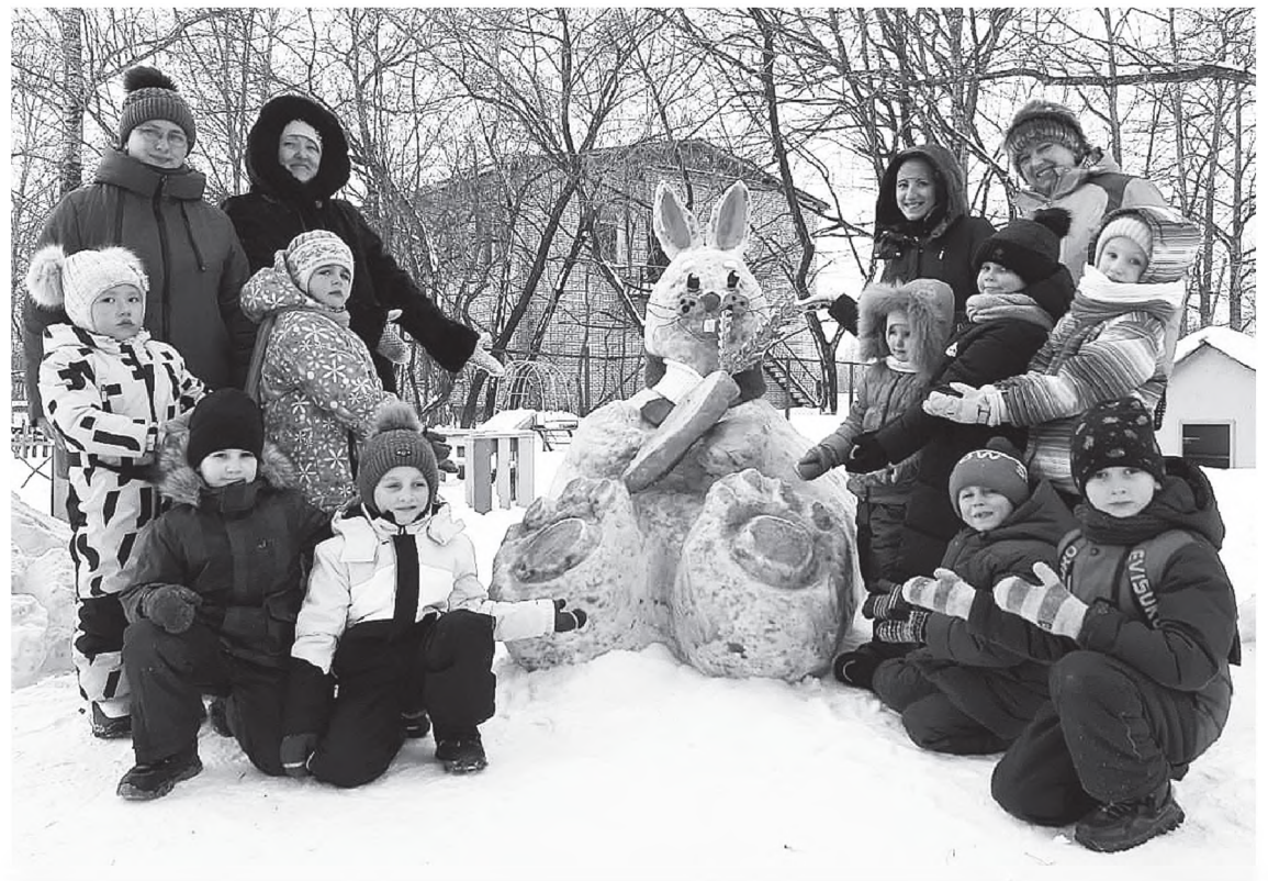
Активное участие в конкурсах приняли детские сады поселка.

Перед новогодними каникулами мы всем классом посетили краеведческий музей района. Поездка в Переяславку получилась запоминающейся.