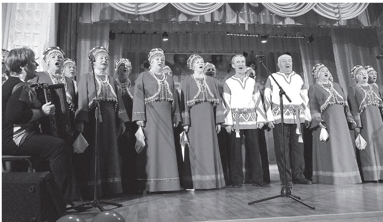
Они не могут жить без «Русской песни».

Наши певунии – настоящие труженицы. Я всегда удивлялась, как это они все успевают