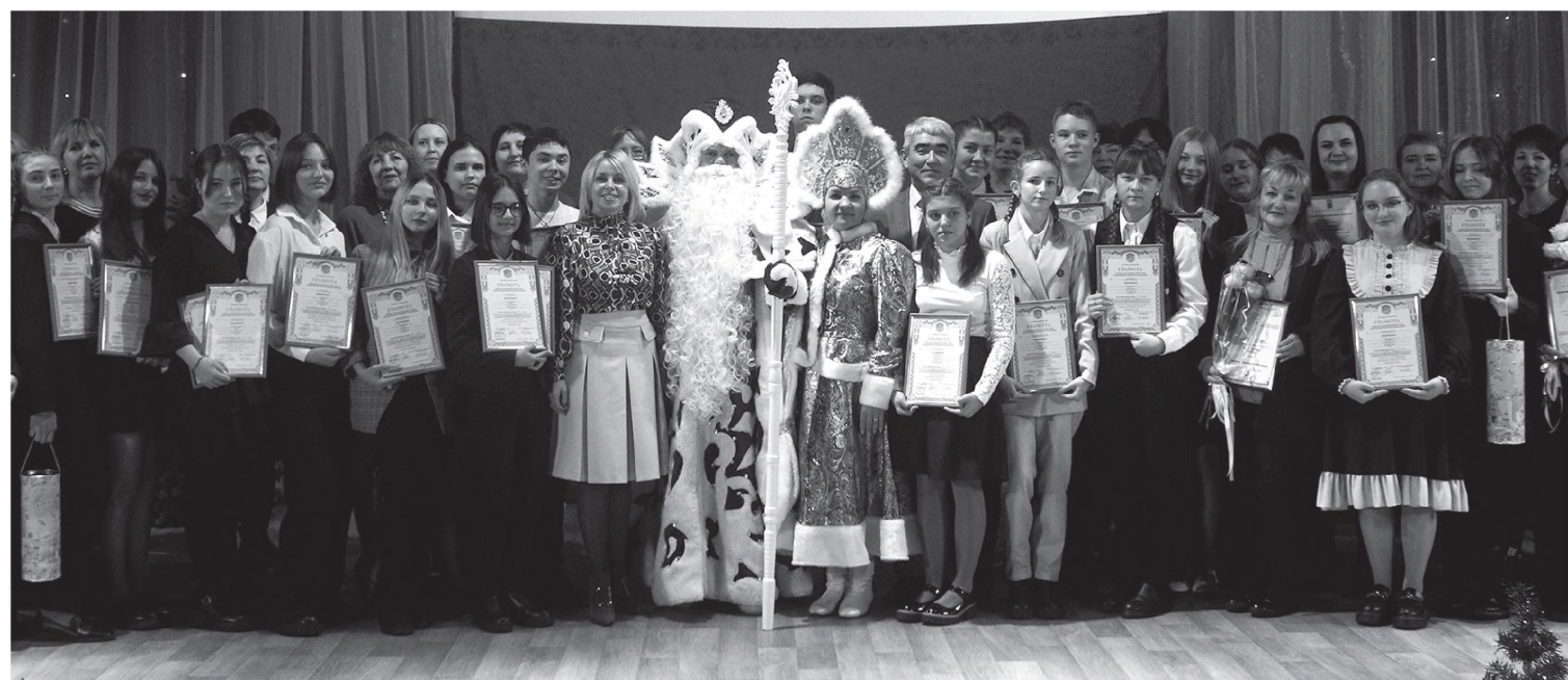
Будущие победители краевого этапа Всероссийской олимпиады школьников

В этом учебном году в районном этапе Всероссийской олимпиады школьников приняли участие почти 400 учащихся из 23 школ района. 37 ребят стали победителями, 31 – призёрами.