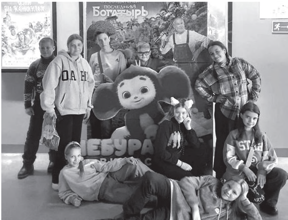
Это были незабываемые каникулы!

Для святогорских школьников был проведен мастер-класс «Рождество уж на пороге» по изготовлению аппликаций из