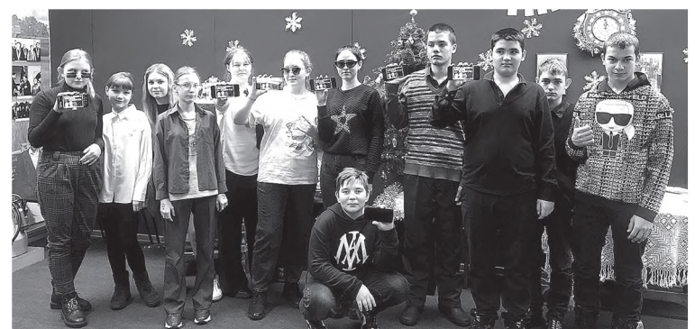
На экскурсии – в музей.

При покупке билетов я и мои одноклассники воспользовались государственной программой «Пушкинская карта». Если вы уже знаете, куда хотите пойти, приложение поможет вам найти ваш музей или театр.