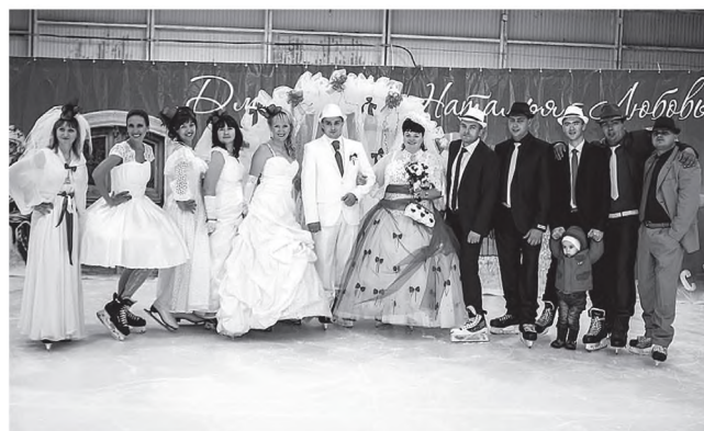
Свадебные хоккейные команды