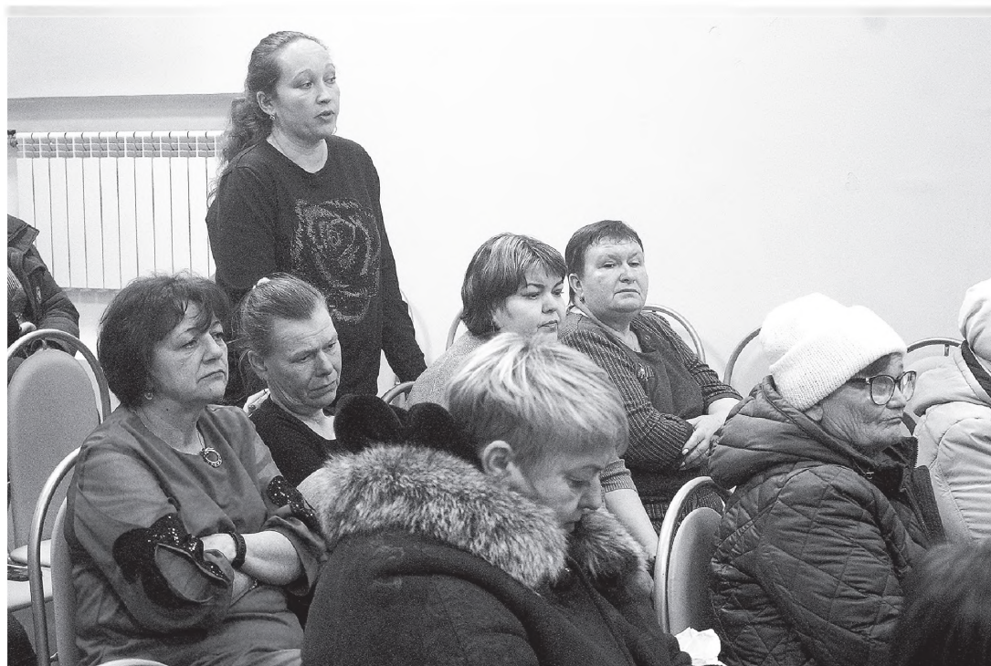
Георгиевцев на встрече волновали многие вопросы.