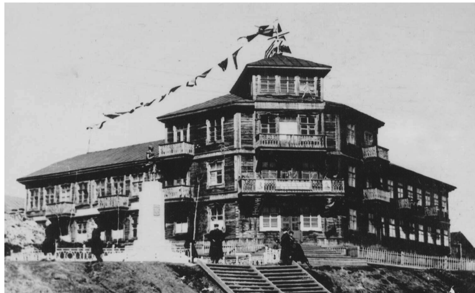
Здание бывшего Николаевского-на-Амуре морского училища, украшенное сигнальными флагами, 1956 г.