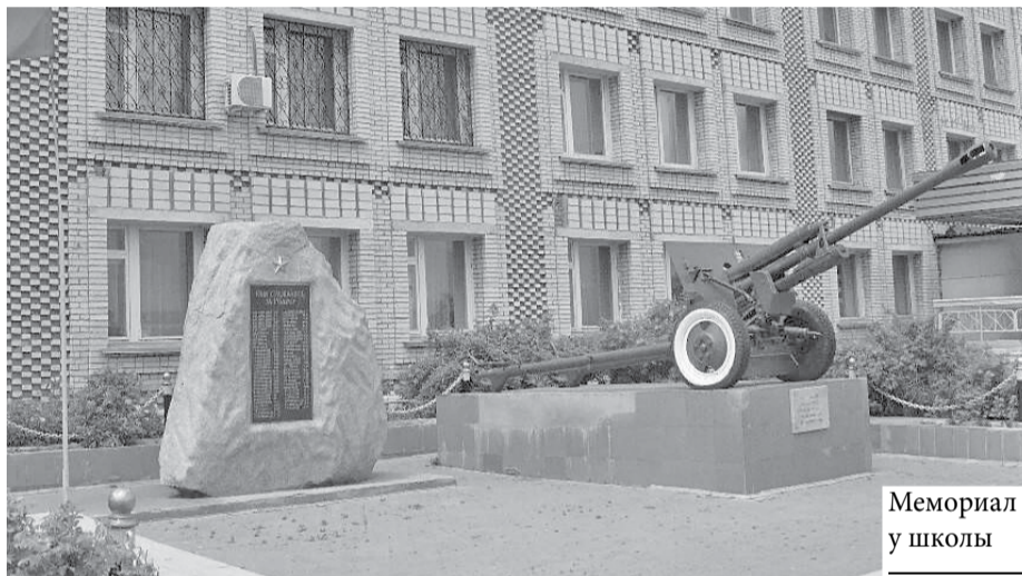
Мемориал у школы

в 1980-е годы был создан совхоз «Заря», ставший флагманом отрасли в крае. Одновременно с вводом мелиорированных сельхозугодий на острове Большом Уссурийском кардинально изменилось и само село. Оно приросло жилфондом, школой, амбулаторией. Правда, Дом культуры распахнул двери только в 2018 году.