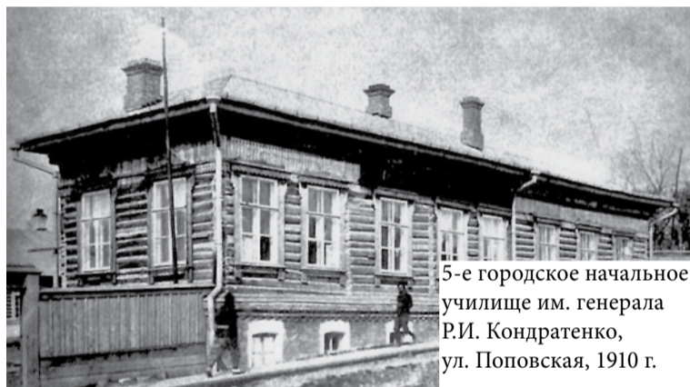
5-е городское начальное училище им. генерала Р.И. Кондратенко, ул. Поповская, 1910 г.