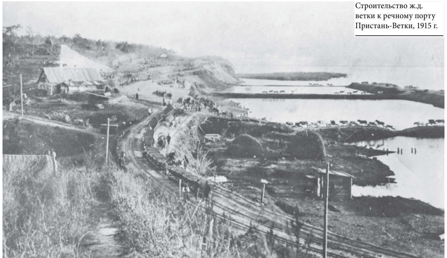
Строительство ж.д. ветки к речному порту Пристань-Ветки, 1915 г.

8 декабря 1909 года Хабаровская городская дума договорилась с комиссией по устройству базы Амурской речной военной флотилии об отводе земли под строительство каменного Осиповского шоссе для соединения базы с городом. Военное ведомство в то время обустроило шоссе от Осиповского затона для соединения с городом базы флотилии – с возведением 14 мостов и переездов. Имея в виду, что улица Поповская (ныне Калинина) в проекте замощения