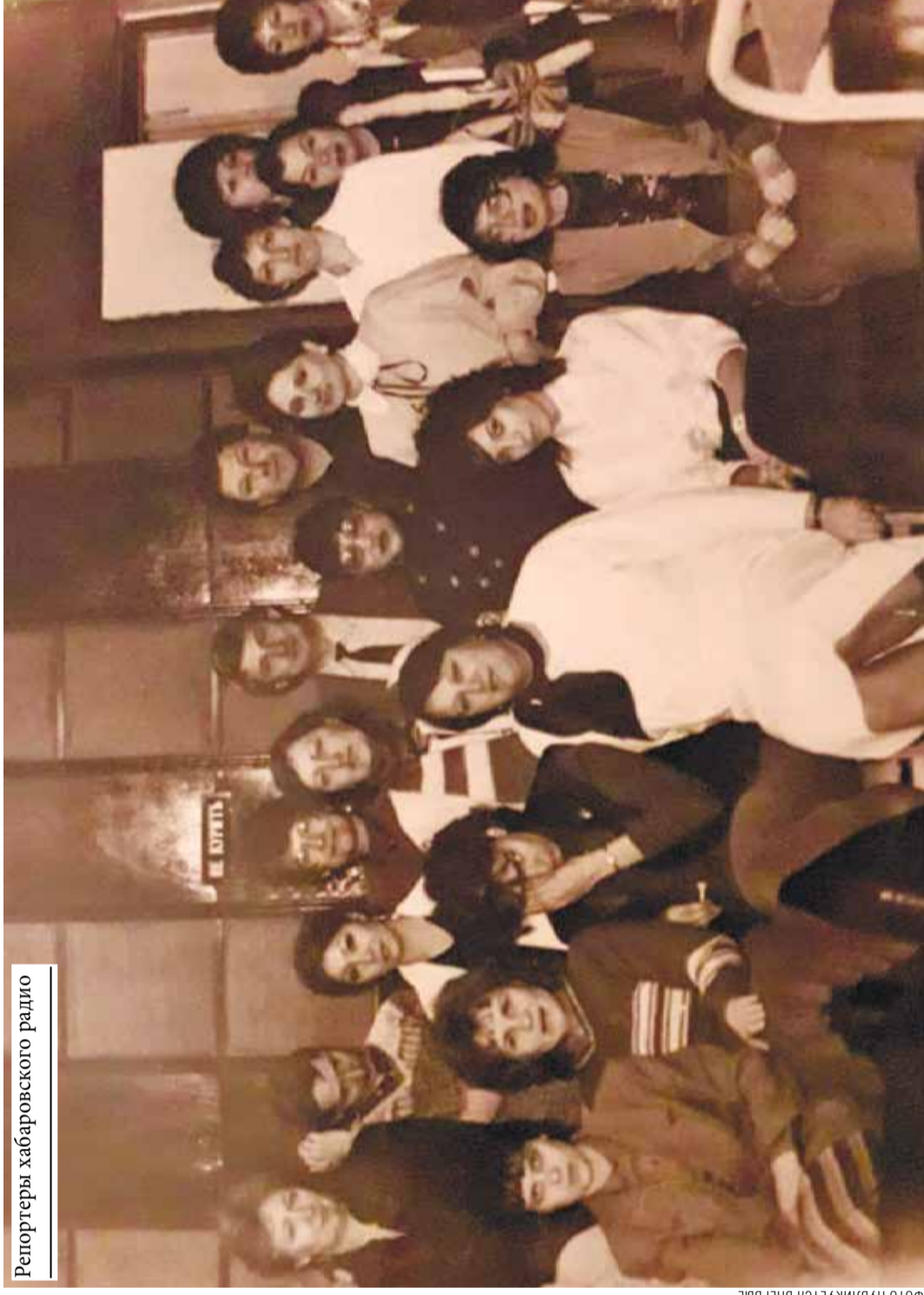
ФОТО ПУБЛИКУЕТСЯ ВПЕРВЫЕ

– Здесь не Смольный! – мгновенно реагирует абонент. Ошиблась номером.