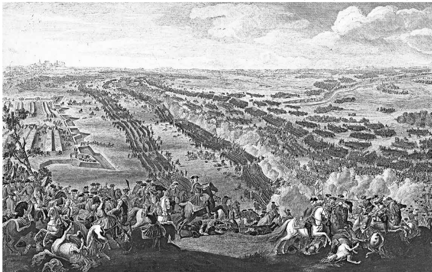
Пьер-Дени Мартин. «Полтавская битва» (1726 год)

Царь начал глобальную реформу в армии. Он сократил число иностранных офицеров, из-за слабой мотивации которых во многом произошла неудача под Нарвой. Началось перевооружение войск и сокращение калибров артиллерии. В битве при Нарве часть пушек просто молчали – снабжение не успело подвезти ядра нужного калибра.