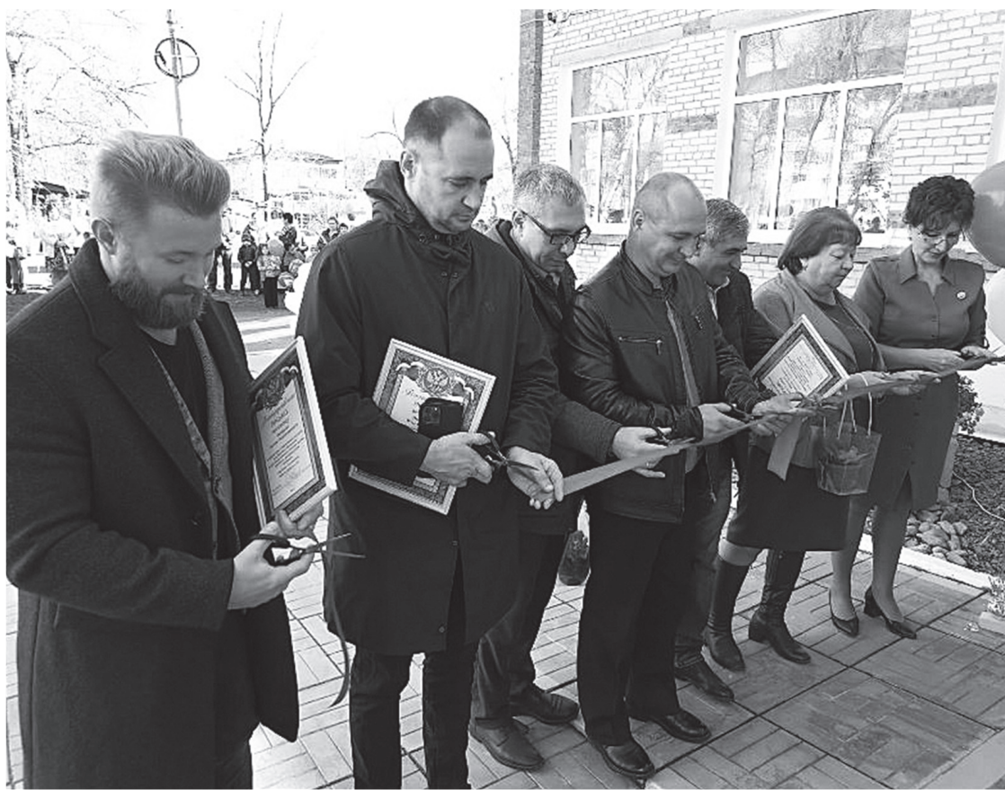
Детсад открыт, символическая лента перерезана.

После четырёхмесячного перерыва вновь распахнул двери для своих воспитанников Хорский детский сад №5 «Радуга».