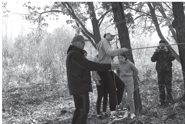
Самая трудная дистанция