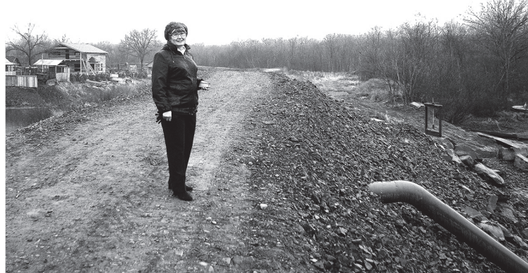
Была построена дамба, которая защитила жителей от наводнения в 2013 году.

шать пока социальные вопросы. По своей прежней работе я много общалась с молодежью, семьями, ветеранами, тесно сотрудничала с работниками культуры, социальными службами. Зато дорожные, коммунальные и прочие проблемы казались неподъемными. Но при поддержке знающих и опытных земляков – специалистов старой, еще советской закалки, настоящих хозяйственников, руководителей организаций и они стали постепенно решаться.