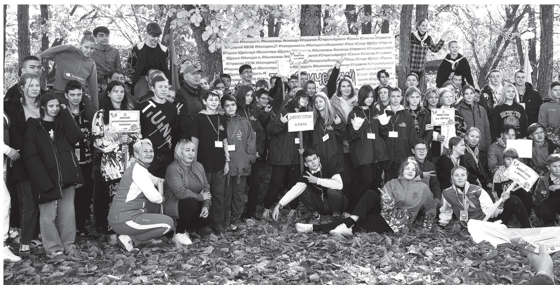
Эмоций взлёт нам дал турслёт!

И вот после разминки на берегу командам объявляется старт, по очереди они отправляются преодолевать полосу препятствия – весьма сложную пешеходную дистанцию. На «мятнике» туристы перелетают через условное болото, далее проходят по одному и всей ко-