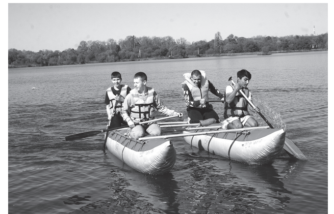
Водный маршрут на катамаранах