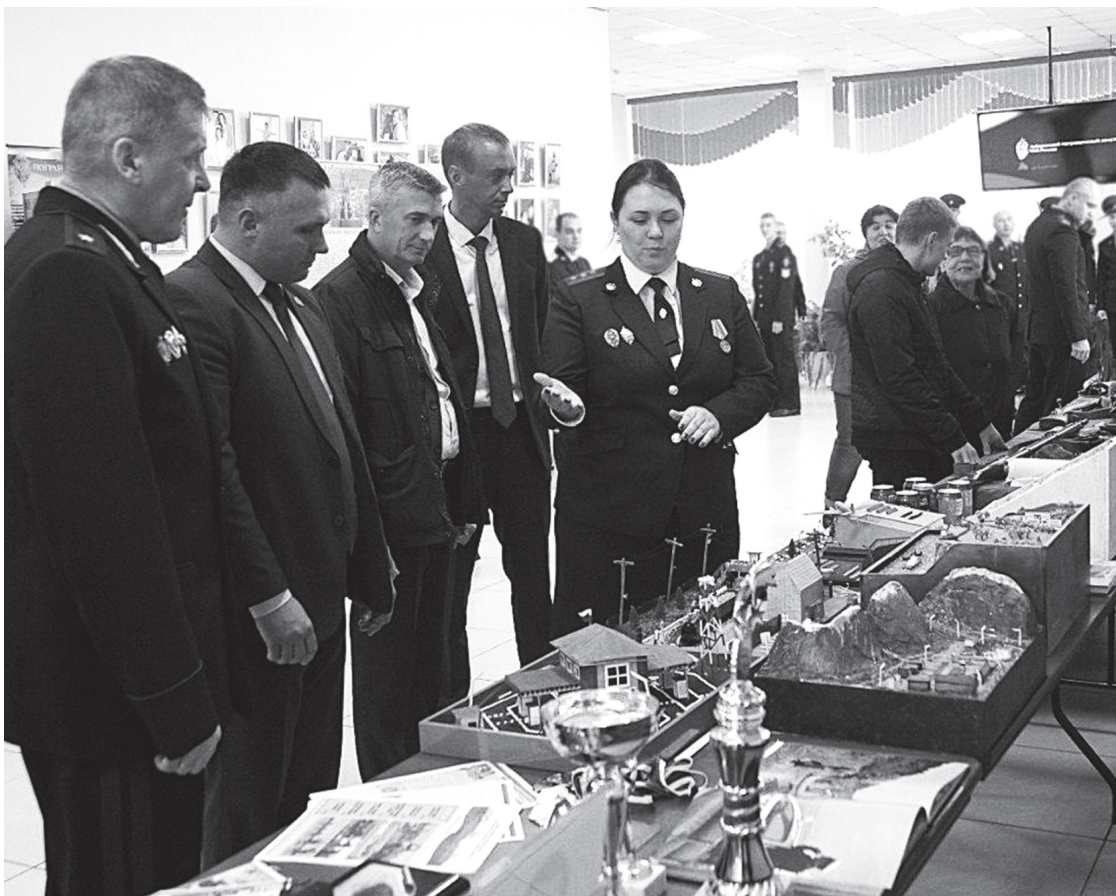
Выставка ХПИФСБ истрелкового оружия заинтересовала всех.

На прошлой неделе в Переяславке состоялась информационно-патриотическая акция для молодёжи района, посвящённая Дню образовательных организаций ФСБ России. Представители Хабаровского пограничного института ФСБ рассказали лазовцам о почётной миссии – быть защитником рубежей родины.