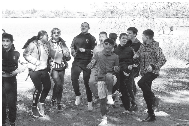
Разминка перед стартом

Много хороших слов было сказано на прощанье организаторам этого туристского праздника. Команды благодарили за предоставленную возможность встретиться и пообщаться со сверстниками, с удовольствием посоревноваться, отдохнуть на природе, попеть и повеселиться. На память о слёте осталось много интересных фотографий