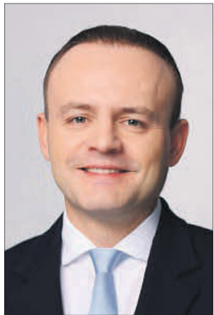
ДАВАНКОВ Владислав Андреевич

Место работы и должность: Депутат Государственной Думы Федерального Собрания Российской Федерации восьмого созыва, руководитель фракции Политической партии ЛДПР в Государственной Думе, председатель Комитета Государственной Думы по международным делам.