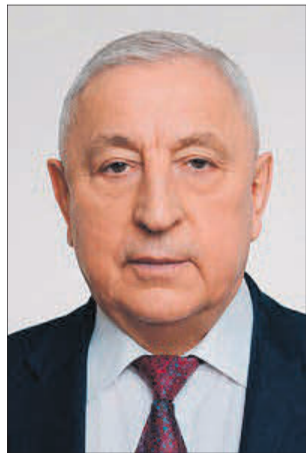
ХАРИТОНОВ Николай Михайлович

Место работы и должность: Депутат Государственной Думы Федерального Собрания Российской Федерации восьмого созыва, заместитель Председателя Государственной Думы Федерального Собрания Российской Федерации, член Комитета Государственной Думы по бюджету и налогам.