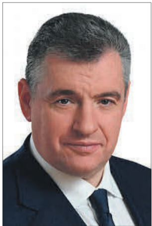
СЛУЦКИЙ Леонид Эдуардович

Выдвинут политической партией «Политическая партия ЛДПР – Либерально-демократическая партия России».